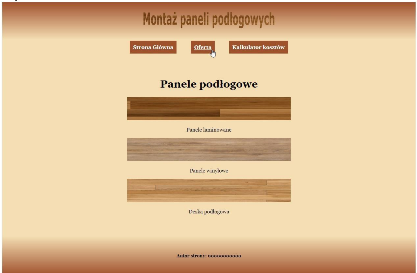
Ilustracja 3. Strona index.html , kursor na drugim odnośniku