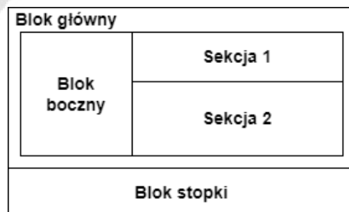
Ilustracja 3. Układ bloków