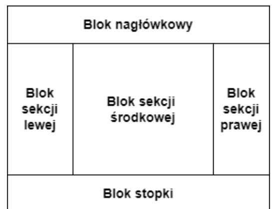
Ilustracja 3. Układ bloków