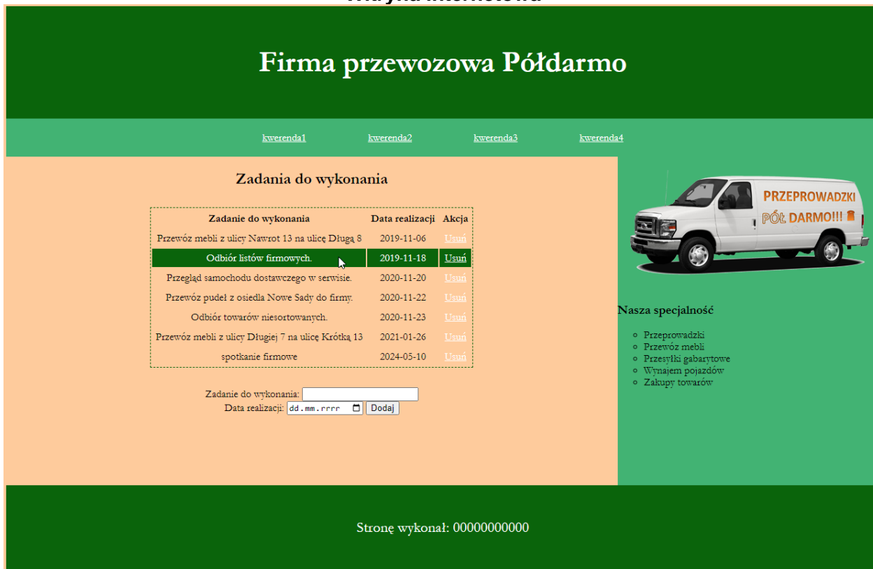
Ilustracja 2. Wygląd witryny internetowej. Kursor myszy na trzecim wierszu tabeli