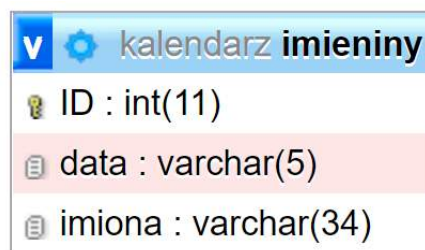
Ilustracja 1. Baza danych

Baza danych zawiera tabelę imieniny przedstawioną na ilustracji 1. Data zapisana jest w formacie mm-dd , np. data 7 listopada zapisana jest jako 11-07.