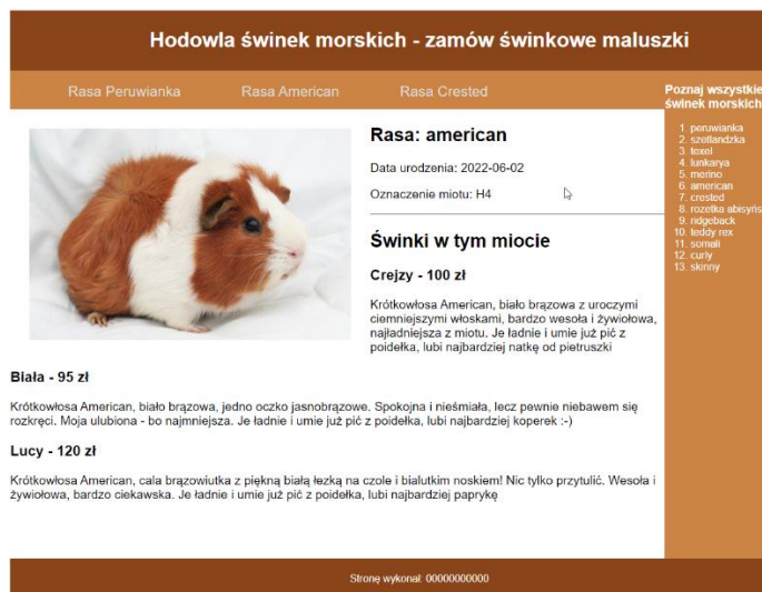
Obraz 4. Zmodyfikowany plik american.php