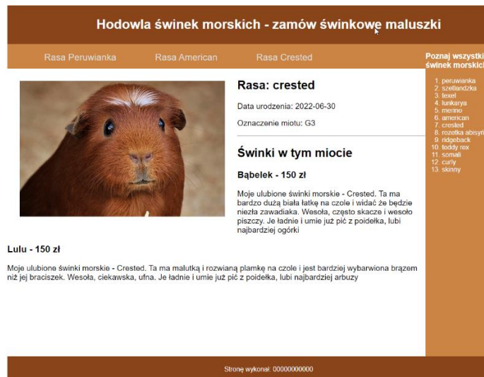
Obraz 5. Zmodyfikowany plik crested.php