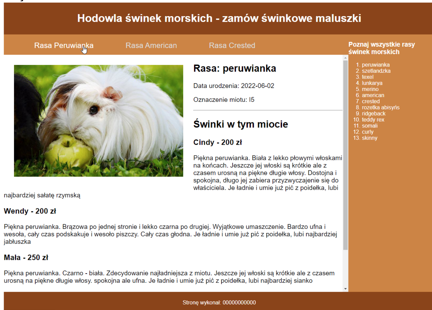
Obraz 2. Witryna internetowa. Kursor myszy na pierwszym odnośniku