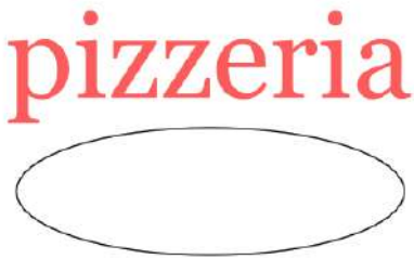
Obraz 1a. Napis i elipsa