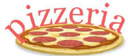
Obraz 1c. Logo pizzerii

Przy pomocy programu do obróbki grafiki wektorowej wykonaj logo zgodne z przedstawionym Obrazem 1c. Kolejne kroki wykonania logo przedstawiają obrazy 1a – 1c.