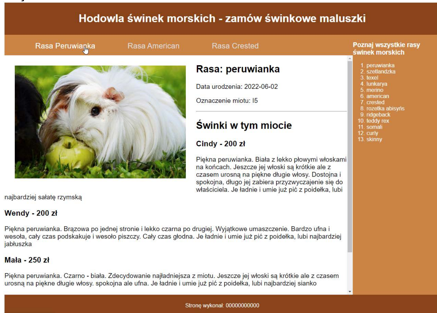
Obraz 2. Witryna internetowa. Kursor myszy na pierwszym odnośniku