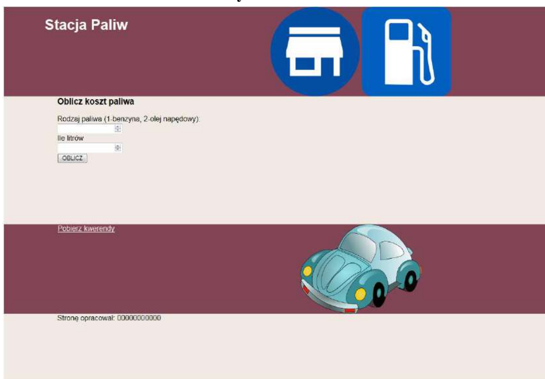
Obraz 1. Witryna internetowa