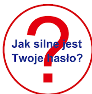
Rysunek 1. Grafika

Witryna internetowa wykorzystuje grafikę, którą należy przygotować i jest ona zgodna z rysunkiem 1.