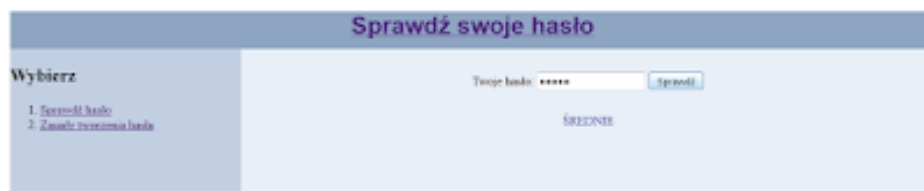
Rysunek 3. Fragment strony hasło.html z efektem działania skryptu

Rysunek 3 przedstawia efekt działania skryptu. Wpisano hasło „qwe12”, zgodnie z tabelą 1 jest ono średnie. Tekst ŚREDNIE w kolorze niebieskim został wyświetlony przez skrypt. Należy zauważyć, że rysunek 3 jest tylko fragmentem wyświetlanej strony.