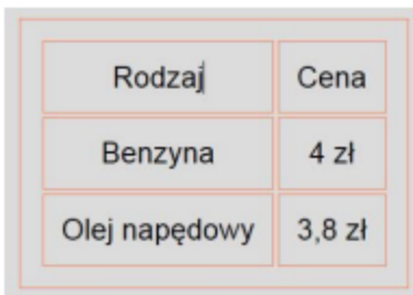
Obraz 2. Tabela z pliku index.html